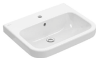
Villeroy & Boch wastafel Architectura wit 60 x 47cm