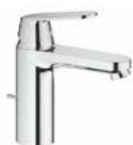
Grohe Eurosmart Cosmopolitan wastafelmengkraan M-Size