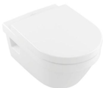
Villeroy & Boch wandcloset Architectura directflush wit Pack incl. closetzitting softclose en quick release