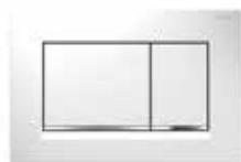
Geberit Sigma 30 wit/glanzend/wit