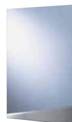
Spiegel 60 x 80 cm