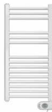
Zehnder Aura elektrische radiator 78 x 40 cm (kleur: RAL9016)