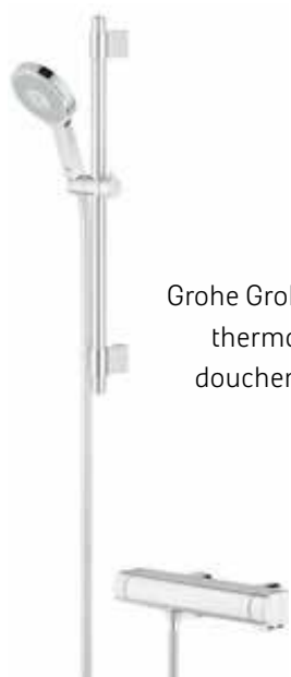
Grohe Grohtherm 2000 thermostatische douchemengkraan