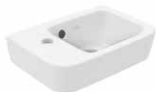
Villeroy & Boch fontein O.novo wit kraangat conform tekening 36 x 25 cm